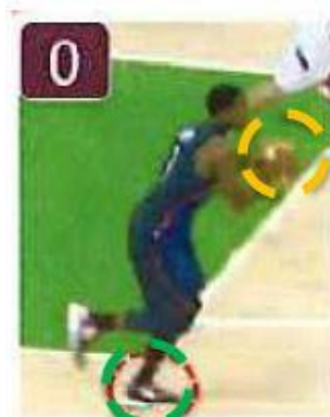
Appui n° 0