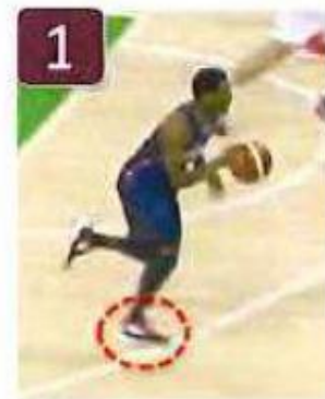
Appui n° 1