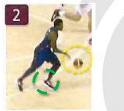
Dribble (ballon lâché) avant pose de l'appui n° 2