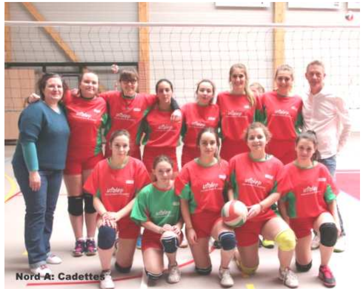
Nord A: Cadettes