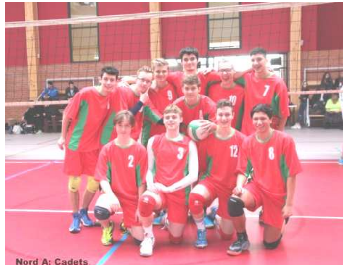
Nord A: Cadets