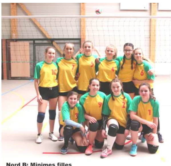
Nord B: Minimes filles