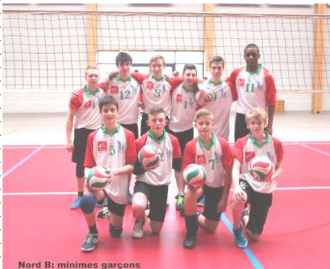
Nord B: minimes garçons