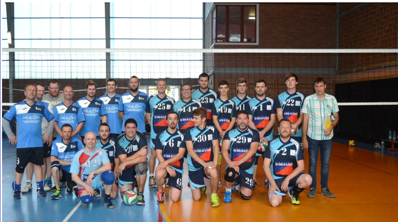
Les équipes de Bully les Mines et de Cuinchy lors de la coupe du Pas de Calais

Le rapport moral est adopté à l'unanimité.