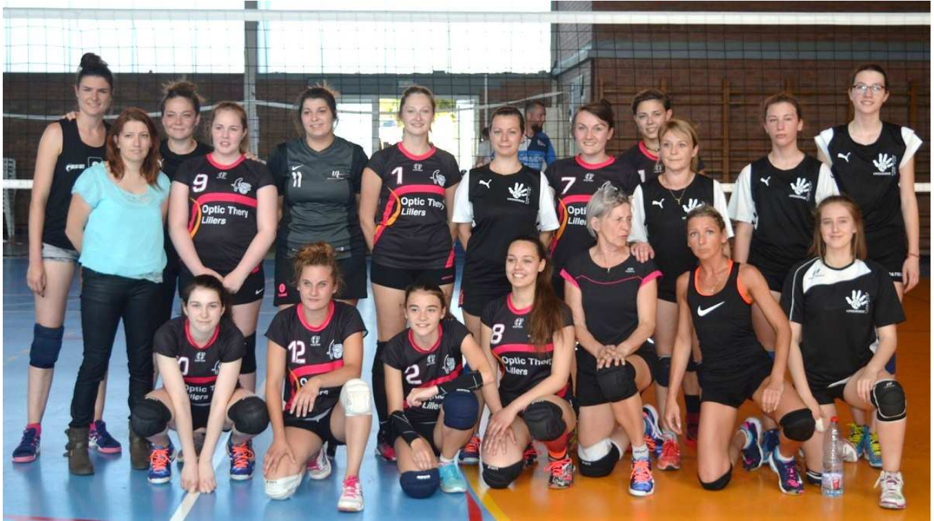
Les formations de Lillers et de Longuenesse