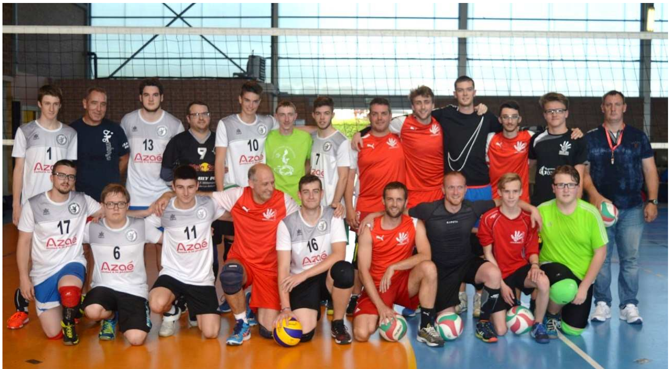
Les formations de l'Entente et de Longuenesse