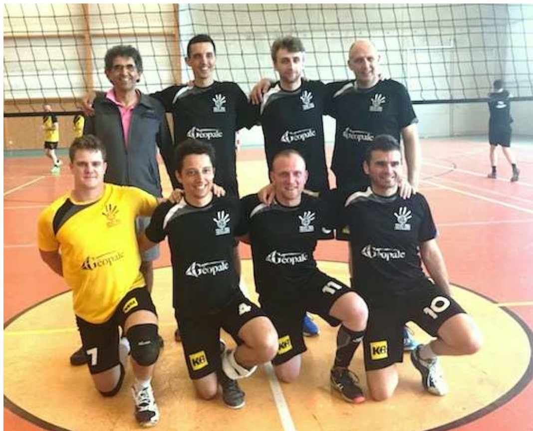
Longuenesse troisième du Critérium Excellence à Villefranche de Rouergue