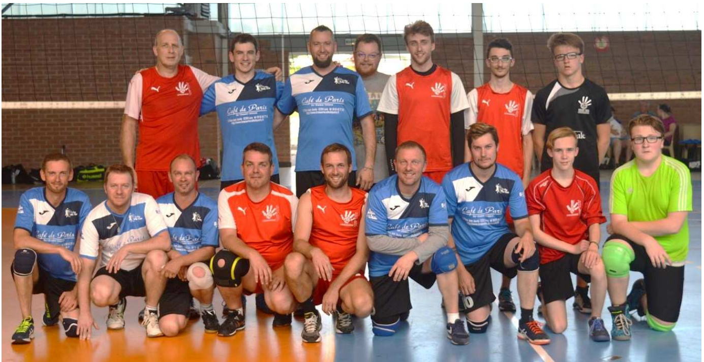
Les formations de Bully les Mines et de Longuenesse