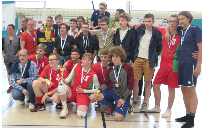
Podium des cadets