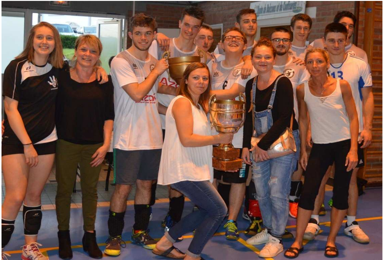
Les masculins de l'Entente et les féminines de Longuenesse tenant les trophées des coupes du 62