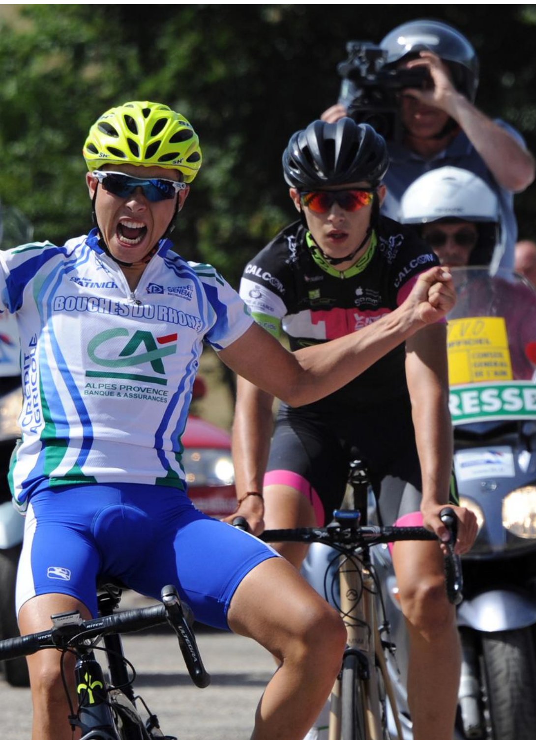
Hotonnes (13) s'impose au terme de la 3e étape (retrouvez les photos de la 3e étape sur leprogres.fr).

AUJOURD'HUI (DÉPART À 13H15 - ARRIVÉE VERS 16H30)