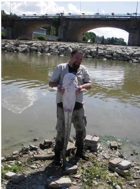
CATTURA DI UN PESCE SILURO