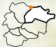
Pic de La Serrera