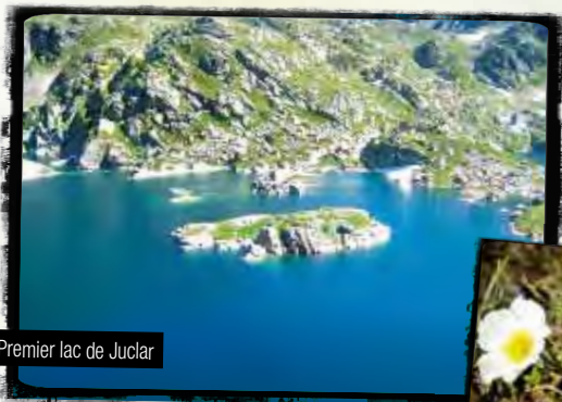
Premier lac de Juclar