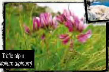
Trèfle alpin ( Trifolium alpinum )