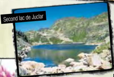
Second lac de Juclar