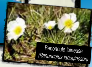
Renoncule laineuse ( Ranunculus lanuginosus )