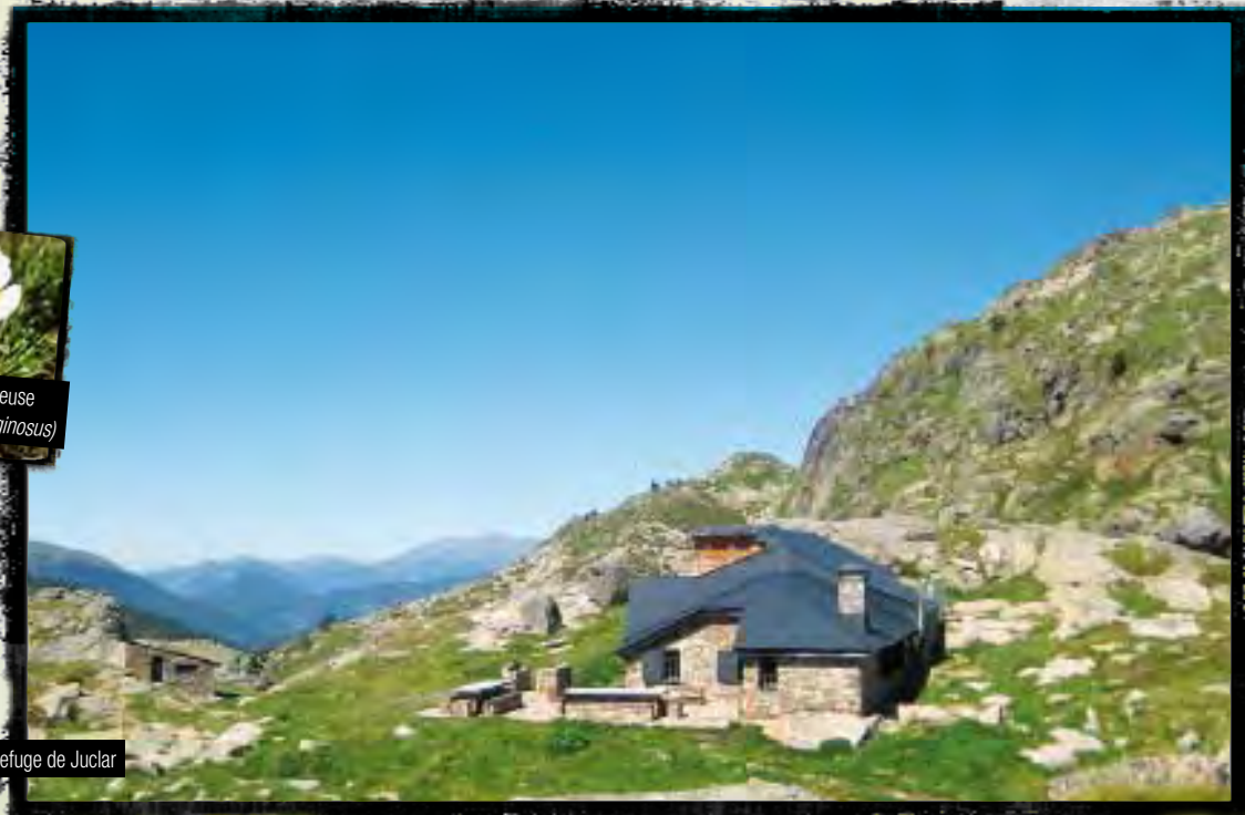
Refuge de Juclar

Le lac de Juclar se trouve au Nord-est de l'Andorre, dans la paroisse de Canillo. Cette paroisse, d'une superficie de 120,76 km 2 , est la première dans l'ordre protocolaire, et c'est la plus vaste de la principauté.