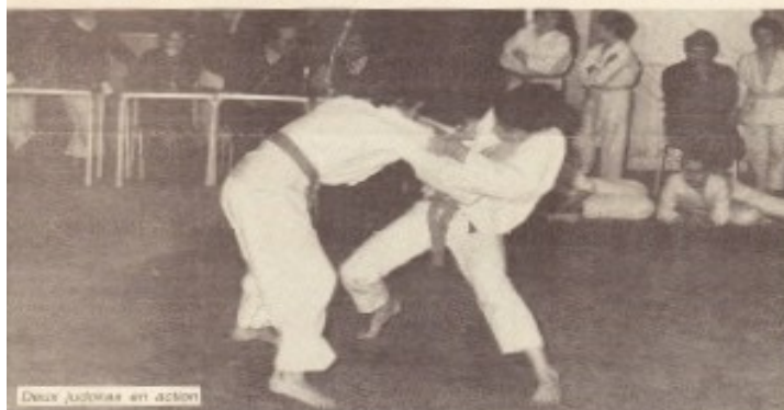
Deux judokas en action