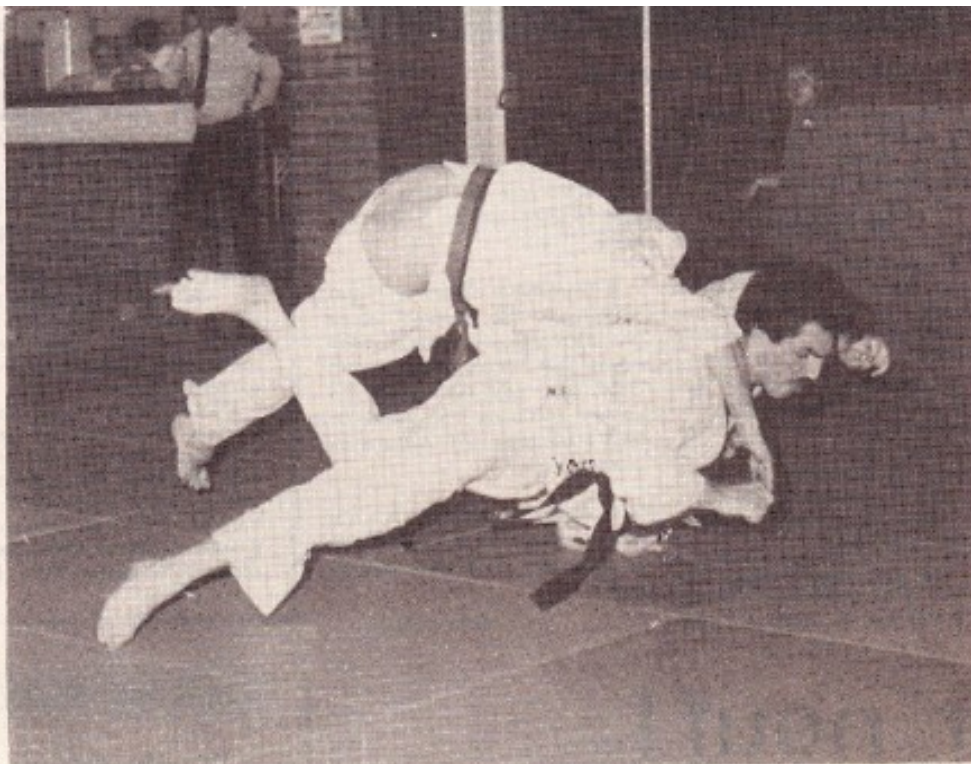
Un combat équilibré qui fut remporté par un Nieppois.