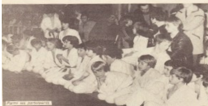
Parmi les participants

Les judokas bailleulois ont remporté le challenge Vandevoorde avec seulement deux petits points d'avance sur le Judo Club Nieppois.