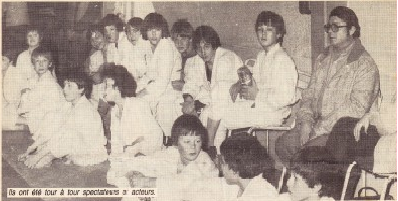
Ils ont été tour à tour spectateurs et acteurs.