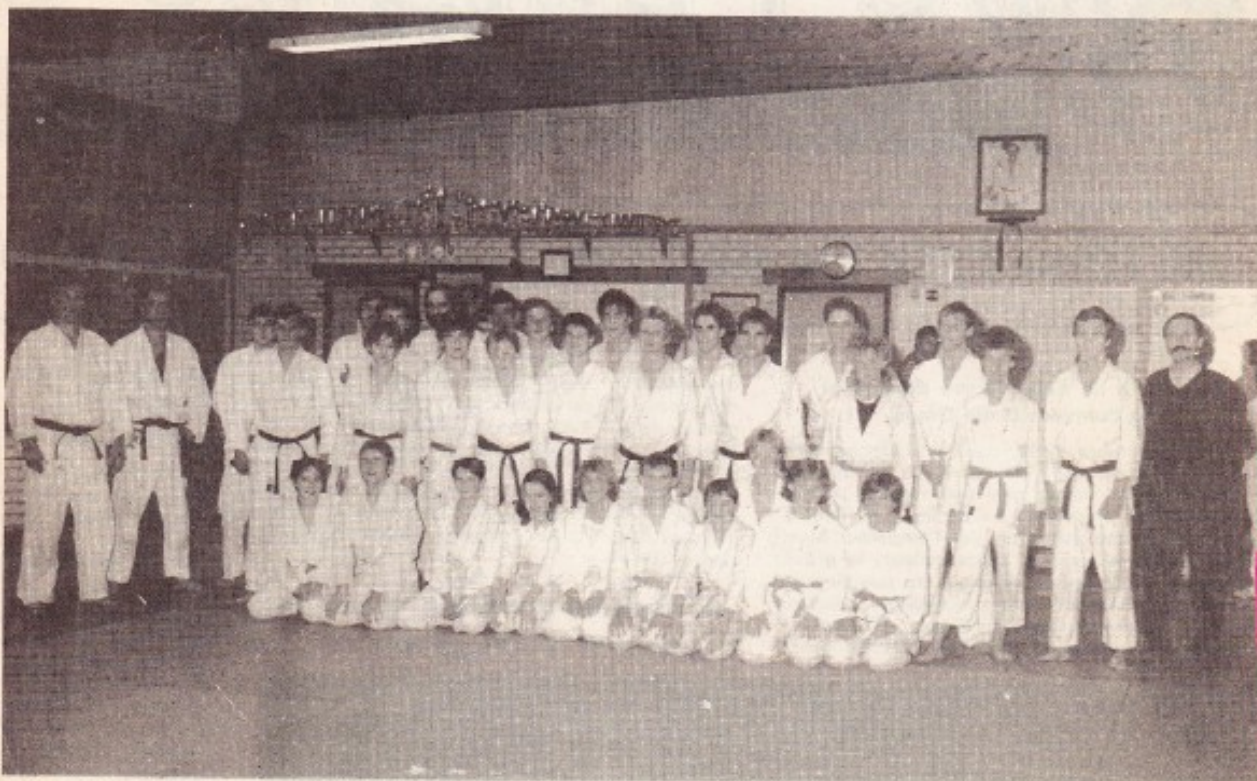
Au Judo-Club Nieppois