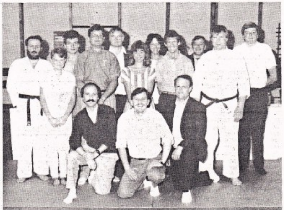
Le dynamique comité du judo-club.