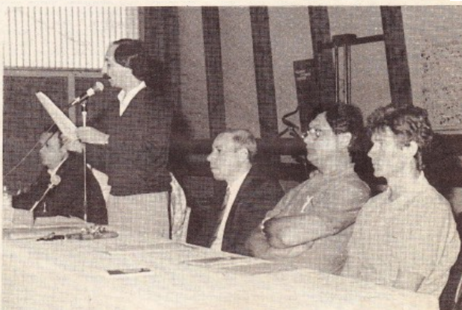
Le comité-directeur lors du rapport du président.