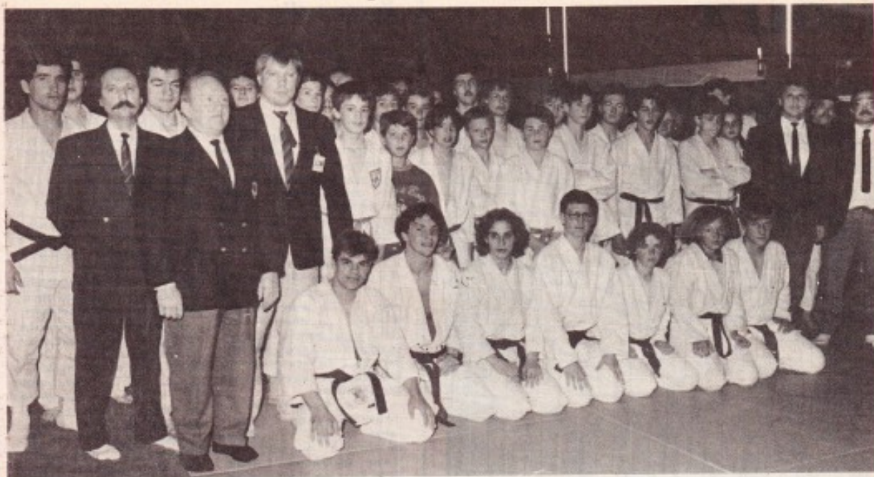
Les équipes ont été applaudies par de nombreux spectateurs à la salle des fêtes.

Samedi, le Judo-club nieppois organisait son gala de judo annuel. La compétition qui se déroulait par équipes de douze combattants était suivie d'un « toutes catégories » féminins et masculins.