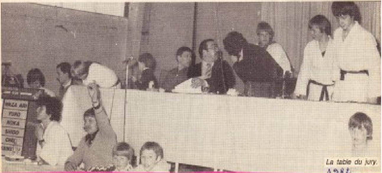
La table du jury. A 982