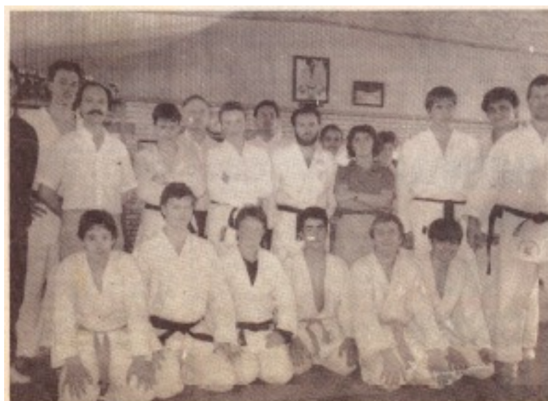
Le groupe des seniors lors d'un entraînement.

pétition, qui se déroulera par équipes de 12 combattants, sera suivie d'un « toutes catégories » féminins et masculins.