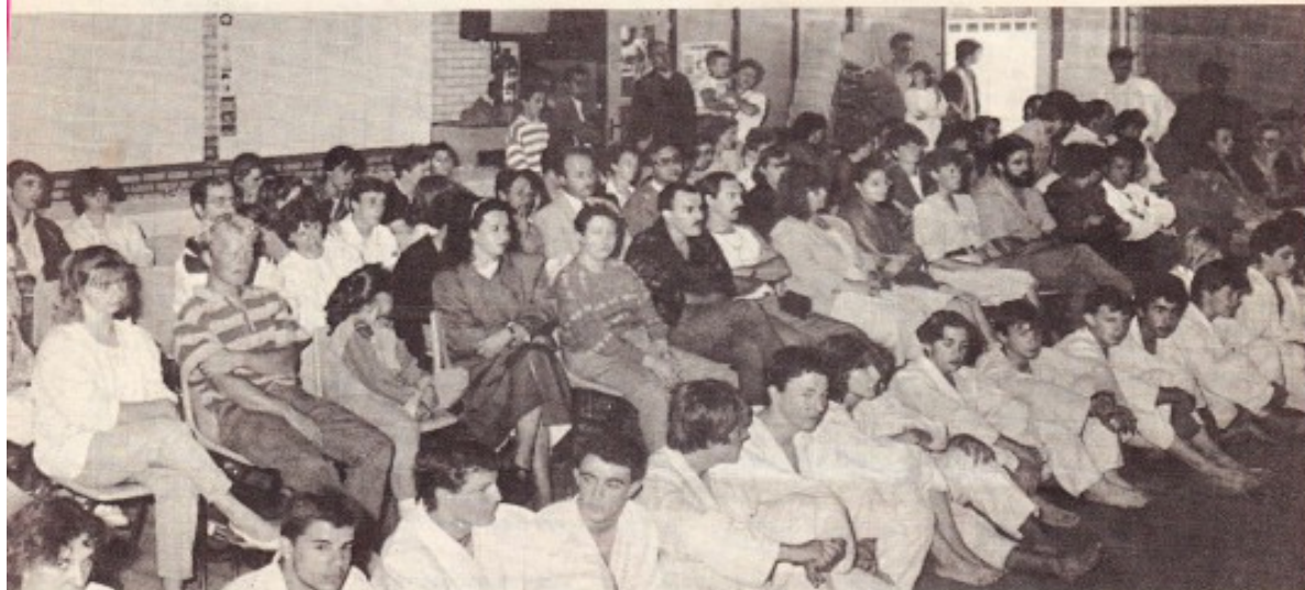
Une salle comble pour une assemblée générale positive.