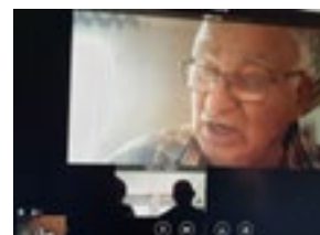
Les réunions se font maintenant en visioconférence