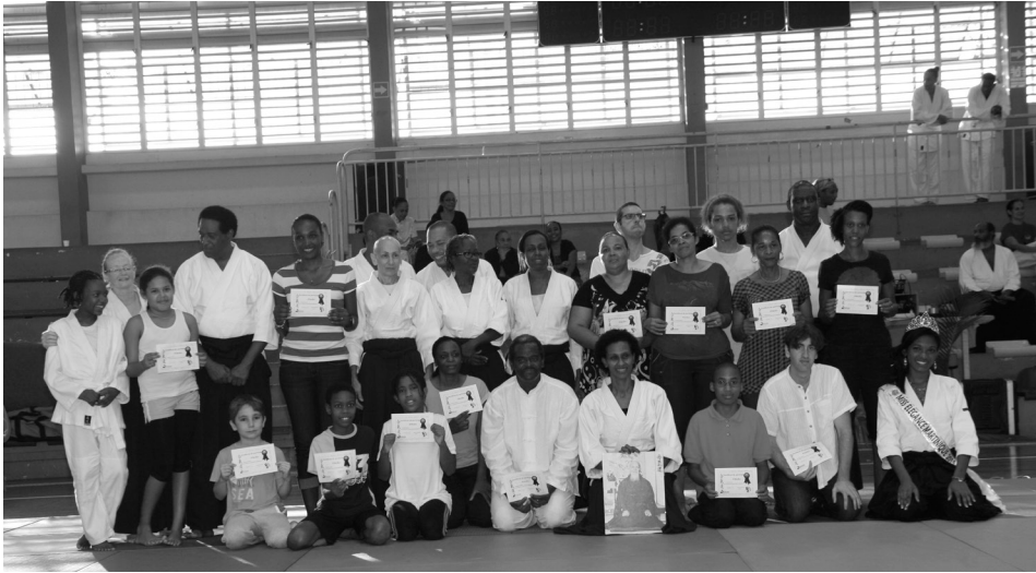
De nouveaux initiés diplômés