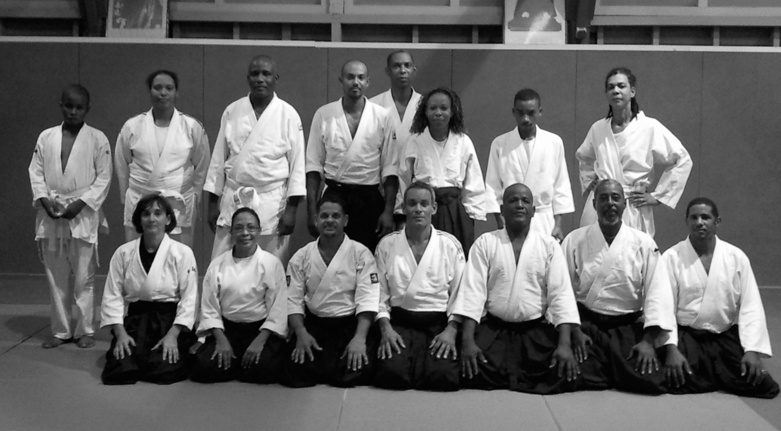
La section Aïkido du Budokai Martinique