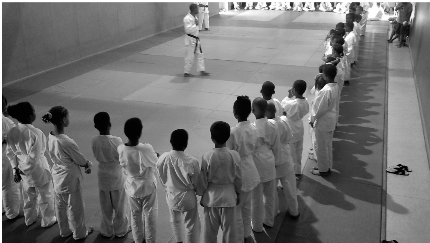
Rencontre de la zone Nord- Atlantique (Poussins- Mini- Poussins)

après d'un tout-public. L'Aïkido a su séduire et a marqué sa place auprès des autres disciplines présentées à ces occasions.