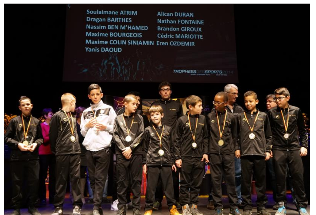
■ Nouveauté cette année : l'affichage sur un écran des noms des récipiendaires.

Plus de photos sur www.estrepublicain.fr .