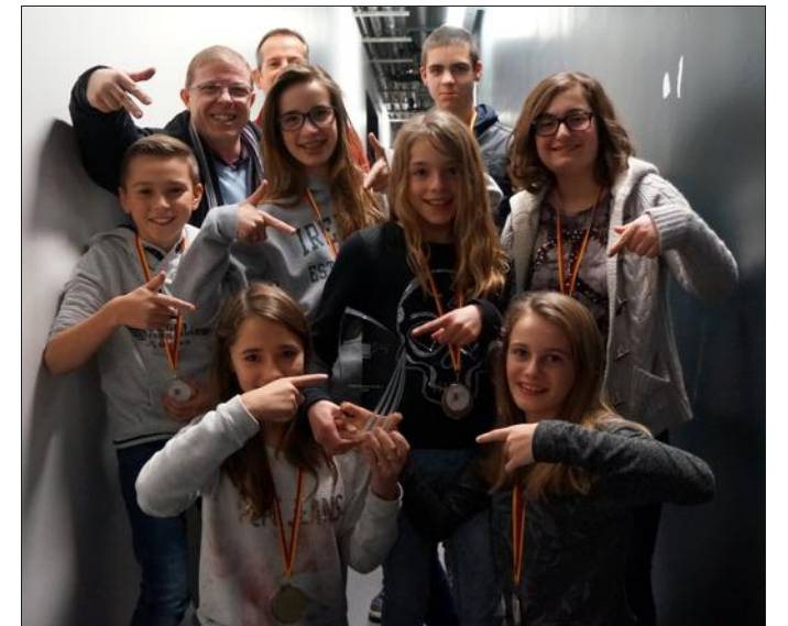
■ L'équipe mixte des basketteurs de l'Espérance de Toul.