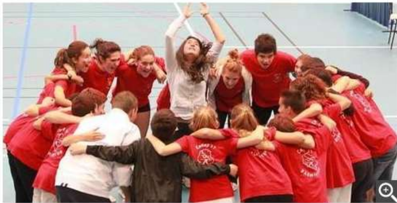
Les jeunes d'Indre-et-Loire peuvent savourer leur qualification pour le tour interrégional.

La phase régionale des intercomités départementaux jeunes avaient lieu ce week-end à Fontaine-la-Guyon (28). Elle opposait les équipes jeunes des six départements du Centre (benjamins, minimes et cadets) sur 15 matchs par rencontre (un simple homme, un simple dame, un double homme, un double dame et un mixte dans chacune des 3 catégories d'âge représentées).