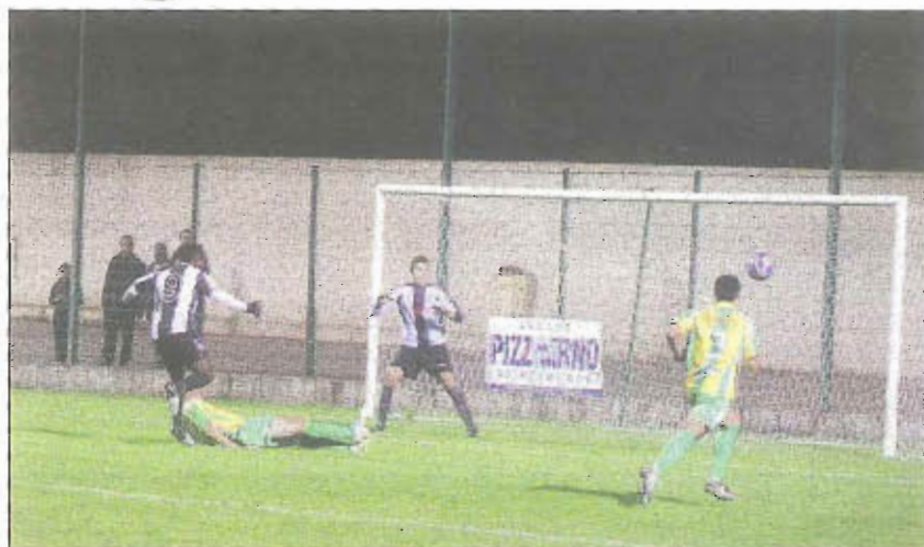
Les « noir et blanc » du Sporting doivent impérativement se relancer, dimanche, face à Manosque.