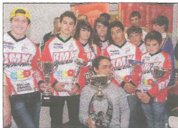
Les couleurs du BMX dracénois une nouvelle fois à l'honneur.

A l'occasion de l'assemblée générale du comité départemental cyclisme du Var, une remise de récompenses a été organisée en l'honneur des champions toutes disciplines confondues (route, vtt, piste, BMX). Les couleurs du BMX dracénois ont brillé, par l'intermédiaire de ses nombreux pilotes vainqueurs du challenge départemental.