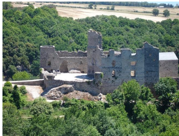
Château de Saissac