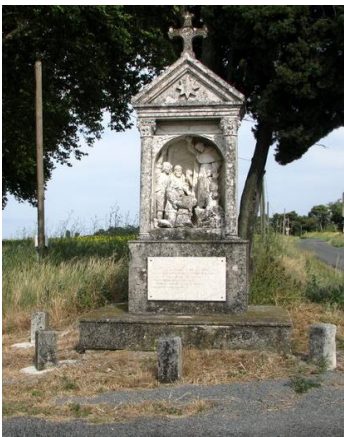
Calvaire en allant vers Arzens

SAINT PAPOUL : L'abbaye de Saint-Papoul. Aujourd'hui église paroissiale, après avoir été cathédrale du diocèse de Saint-Papoul, l'abbaye offre avec son cloître du XIV e siècle un ensemble architectural assez bien conservé. L'ancien palais épiscopal ou ancien château. Le château de Ferrals fut construit à partir de 1567 ; il reçut la visite de Charles IX de France et de Catherine de Médicis. Chapelle reconstruite au XIX e siècle, au lieu-dit l'Hermitage, où fut martyrisé saint Papoul.