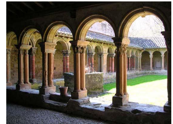
Abbaye de St Papoul