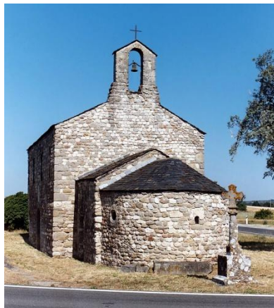
Chapelle Sainte Madeleine près de Pezens