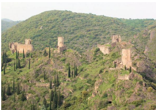
Les 4 Châteaux de Lastours depuis le Belvédère

SAINTE MARTIN LE VIEIL : Village d'origine troglodytique.