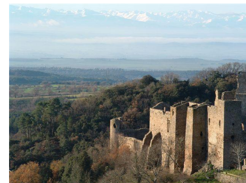
Château de Saissac avec vue sur les Pyrénées