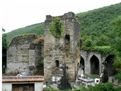
Eglise Saint Pierre de Vals