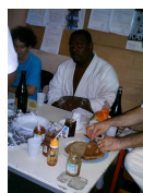
... au palais des sports du Lamentin

Chez les adultes, les motifs de faire la fête ne manquent pas. En effet, après le cours d'une heure et demi, les pratiquants étaient conviés à une partie de crêpes maison, arrosée bien entendu de cidre.